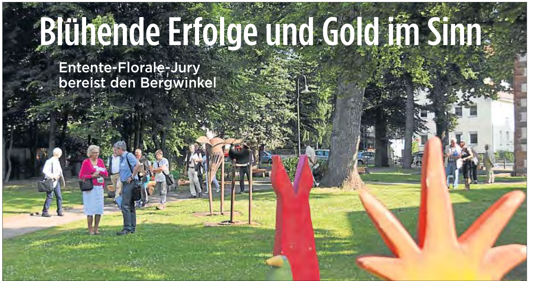
Eine Entente-Florale-Jury besuchte letztmals am 13. Juli 2013 Schlüchtern. Damals wurde in erster Linie die Innenstadt unter die Lupe genommen.