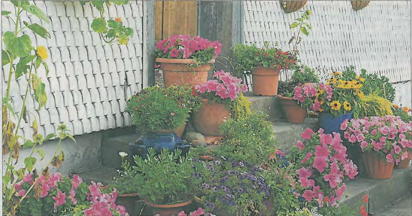
Bunte Blumengröße, wie hier aus dem Stadtkern Schlüchterns, erfreuten auch die Jury.